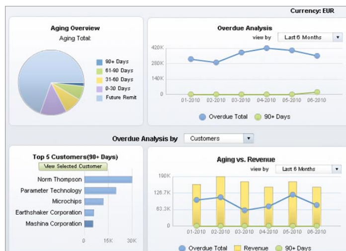
Figure 1: Dashboard financeiro retrospectivo pré-criado no SAP® Business One

Relatórios podem ser exportados nos formatos que melhor atendam a suas necessidades de negócios, incluindo aplicativos Adobe PDF, Microsoft Word, Microsoft Excel, RTF e XML. Você pode imprimi-los e enviá-los por fax ou email. O download do visualizador do SAP Crystal Reports possibilitará exploração interativa dos arquivos do SAP Crystal Reports, com ou sem uma conexão de rede, ou em uma reunião com clientes, ou viagem de negócios. Com essa flexibilidade, você pode ficar em contato com seus negócios, onde estiver.